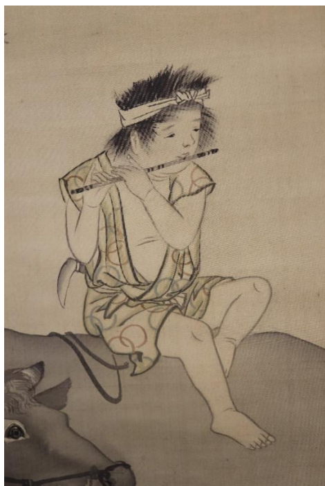
【図6】森徹山《柳下牧童図》（部分）