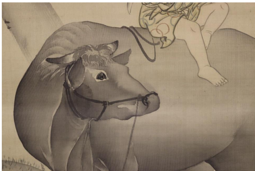
【図5】 森徹山《柳下牧童図》（部分）

「牧童牧牛図」は、中国の宋代の禅文献の中で言及されており、修行と悟りの過程を10枚の絵と偈頌によって示している。逃げた牛を探し出して、一緒に家に帰り着いた後、人と牛ともに姿を消した逸話を説く。これについては複数の物語が存在するが、いずれにせよ、宋代禅の発展によって日本で盛んに描かれ、禅芸術の根拠となった。徹山の《柳下牧童図》の源も、このような禅宗の戒めを描いた「十牛図」の図様にまで遡るが、この画題は、室町時代の雪舟も描いている。要するに、徹山の《柳下牧童図》は、室町時代以来続く人気画題であった。徹山も江戸時代後期に流行した「牧童牧牛図」の図様を選択したわけであるが、この作品は、江戸時代後期という時代から考えると、蘆雪との関係を仄めかすとともに、京と大坂の画家たちの交流と、同時代的な雰囲気を表している。父親の森周峰にも《雨中牧童図屏風》（個人蔵）があり、森派でも一般的な図様であったことが窺える。