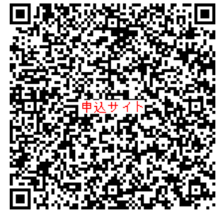
申込サイトQRコード