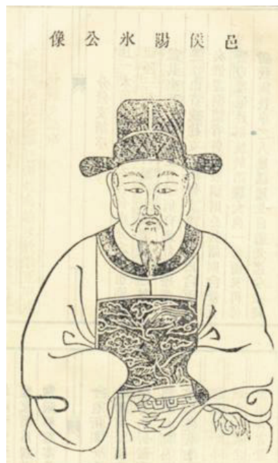
图1 李阳冰画像，李阳冰，字少温，生卒年不详。

李砚的《李阳冰篆书风格的研究与借鉴》 3 ，从美学方面对李阳冰进行深入研究，提到了产生李阳冰独特的小篆形态的文化动因：李阳冰生活在唐代，有尚法的观念，这对其小篆的风格形成有重要影响，还有他的书学背景也是其中一个重要因素；还论述了有关李阳冰的篆书创作思想，以及他独到的美学观；同时，对李阳冰留存后世的代表作品进行了美学方面的分析，找出其小篆的字形形态的特点；接着详细分析了李阳冰小篆的造型形态，将其