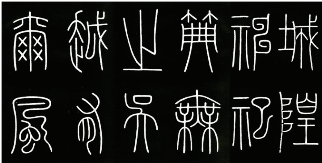
图3《城隍庙碑》又称《缙云县城隍庙记碑》，唐乾元二年（759）刻，宋宣和间方腊造反，刀兵所及，碑石断裂，文字残缺，现存为宋宣和五年（1123）十月缙云县令吴延年根据拓本重刻，保存颇为完整，现存于缙云县博物馆碑廊。

与唐、宋、元相比，对李阳冰批判的声音到明末清初时则更加强烈，而且更加集中，例如明代何良俊《四友斋书论》有云：“唐时称李阳冰，阳冰时作柳叶，殊乏古意，间亦作小篆，然不见有劲挺圆润之意，去李斯远矣。” 30 明代赵宦光在《寒山帚谈》中也曾提到：“李阳冰诸碑，不下数十种，其笔过柔，其格最下，颇无所取……” 31 清代钱泳在《书学》中说：“观徐鼎臣所模《峯山》、《会稽》、《碣石》诸刻，尚得秦相三昧，而唐之李少温，宋之梦英、张有，元之周伯琦，明之赵宦光，愈写愈远矣。” 32